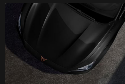
Negro Media Noche