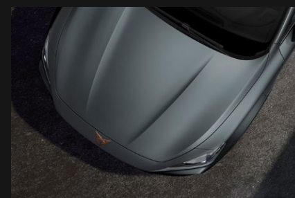
Gris Encelado Mate *Disponible en versión VZ