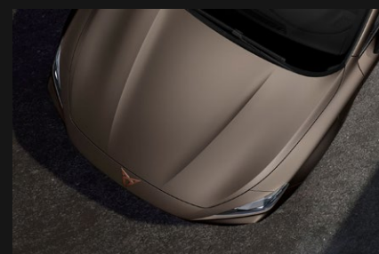
Bronce Century Mate *Disponible en versión VZ