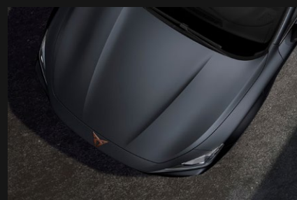
Gris Magnético Mate *Disponible en versión VZ